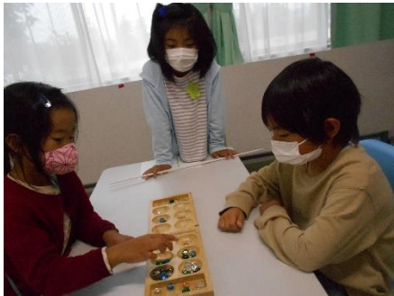
マンカラ大会 64人が参加し、熱い戦いをしました