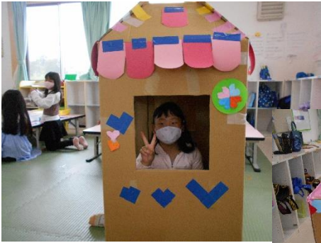
ダンボールハウス ねずこ柄に飾ったよ